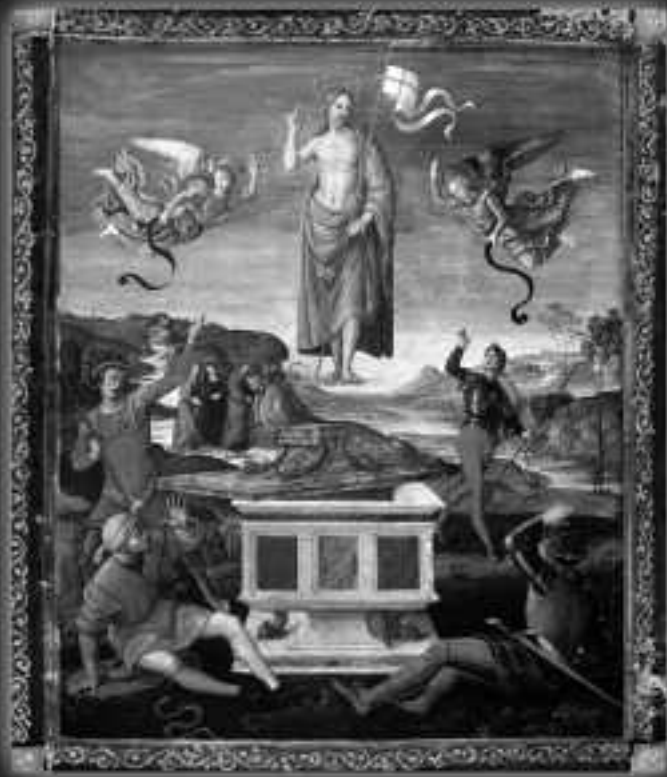
Învierea lui Cristos de Rafael (1483-1520)